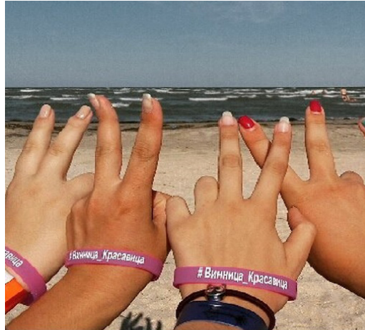
natali_mulyar А ми на моорі! #Винница_красавица #студреспубліка