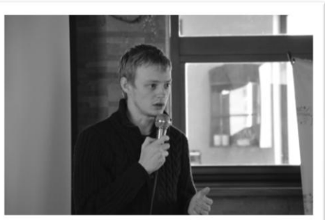
7 Сил Влади